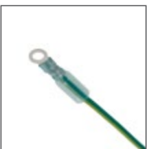
Solderless Ring (无焊环形端子)