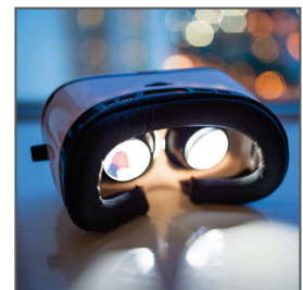
增强现实/虚拟现实头戴设备