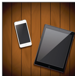
智能手机和平板电脑