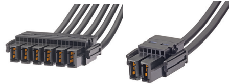
EXTreme Guardianハイパワーケーブルアセンブリー