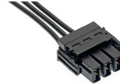
EXTreme Guardianパワー用コネクター

EXTreme Guardianシステムは、ブレードあたり 定格電流80.0A、EMI/RFI遮蔽機能付 高電流密度オプションを提供可能。 優れた電気的性能を実現