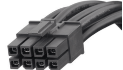
Mega-Fitパワー用コネクター

Mega-Fitパワー用コネクターは、定格電流23.0A、 高品質ハウジングを使用 高電流、高信頼性を提供