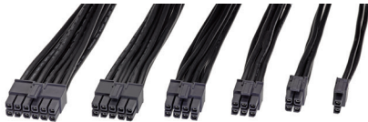
Mega-Fitハイパワーケーブルアセンブリー

EXTreme Ten60Powerは、最大定格60.0Aの パワー用ブレード端子を使用 最大の電流対長さ比を保証