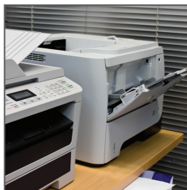
プリンター & コピー機